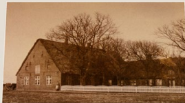
Mühlentof um 1900, rechts das ursprüngliche Wohnhaus